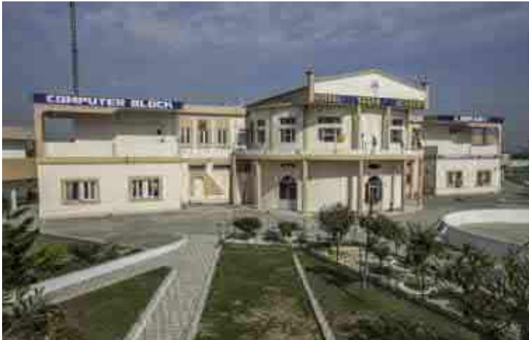
Kirpal Sagar Akademie

gewachsen sein. Um diese lebensnotwendige und unerläßliche Aufgabe durchzuführen, muß die ganze Art der Erziehung verändert werden, damit sie der Gesellschaft junge Männer und Frauen geben kann, die nicht nur intellektuell, sondern auch emotional gefestigt sind, um tatkräftig, wirklichkeitsnah und konstruktiv eine führende Rolle einnehmen zu können. Wir erstreben eine solche Atmosphäre, in der Menschen heranwachsen und sich vollkommen entwickeln können, ohne die Verbindung mit ihrer Seele zu verlieren. Das Ziel ist, dies zu einem Platz zu machen, wo die Bedürfnisse des Geistes und die Bedeutung der Weiterentwicklung des Menschen Vorrang haben vor materieller Befriedigung, Freuden und Vergnügungen. Selbstverständlich wird der Schwerpunkt der Erziehung, die hier vermittelt wird, spirituell ausgerichtet sein und nicht darauf liegen, Prüfungen zu bestehen, Zertifikate und Diplome zu erwerben und eine Anstellung zu suchen, sondern die bestehenden moralischen, ethischen und anderen Fähigkeiten zu steigern und neue Möglichkeiten und Horizonte zu eröffnen, um den Traum von der Wirklichkeit zu erfüllen.