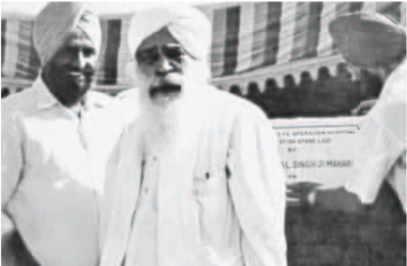
Dieses Foto wurde aufgenommen, als Meister den Grundstein legte. Es erschien im Englischen Sat Sandesh vom Januar 1974.