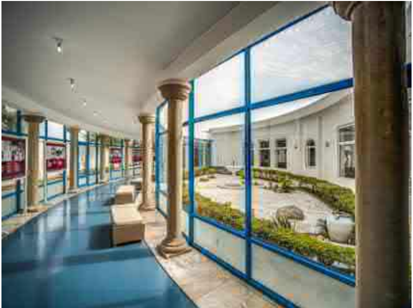
Bibliothek (oben) und Gemeinschaftsküche (unten)